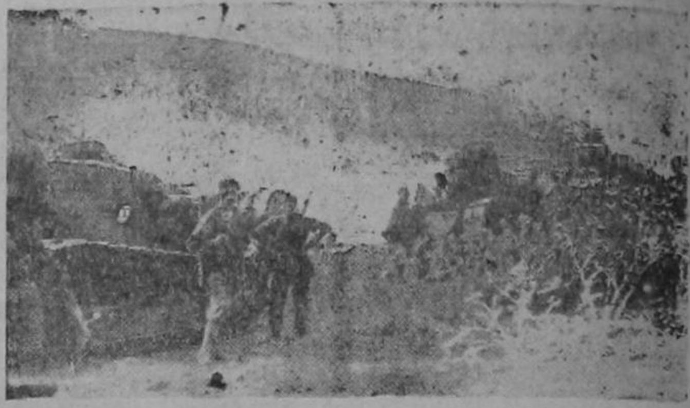
La guerra en Marruecos. Una columna de tanques, dirigiéndose a Terral

Vivía este santo mártir en Roma, reinando Claudio II, hacia el año 270. Su virtud y sabiduría le habían granjeado la veneración de los cristianos y aun la de los gentiles. Mereció el nombre de padre de los pobres por su caridad y el celo por la Religión Ganaba primero los corazones para sí y después para Jesucristo. El emperador gustó tenerle a su lado, y le halagó para que apostatase; pero Valentín firme en la fe de Cristo, respondió al gentil emperador que antes se debe obedecer a Dios que a la potestad secular en materia de fe y de costumbres, y que los dioses del paganismo eran mera fábula. En su consecuencia le metieron en la cárcel, como cristiano y enemigo de los dioses del imperio. Estuvo preso algunos días cargado de cadenas, y fué apaleado varias veces, hasta que al fin, viendo su constancia en confesar la fe verdadera, fué degollado fuera de la ciudad en la vía Flaminia, que va a Umbría, el año 270. Los cristianos recogieron el cadáver y lo enterraron allí mismo, en el lugar que hoy se llama Puerta del Pópulo; y más tarde el papa Julio I mandó levantar un templo, que está en mucha devoción en Roma.