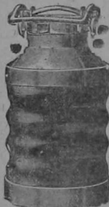
pinturas Alabastin etc.

CATRES Americanos grandes y pequeños. Felpudos Mangueras alambradas.